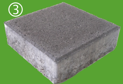
Después del desgaste de la eflorescencia