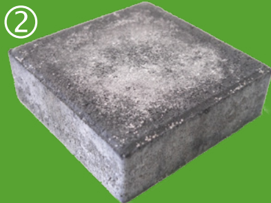
Eflorescencia después de 3 a 9 meses